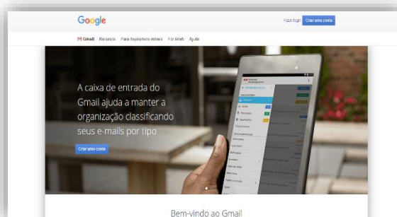
Tela inicial do Gmail

O Gmail é o e-mail do google por isso você também pode acessá-lo através da página do google.