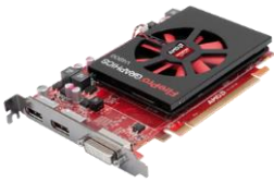
PLACA DE VÍDEO SOM

PLACAS DE EXPANSÃO: Permitem que se acrescente novos recursos ao computador, aumentando a sua capacidade. Por exemplo: